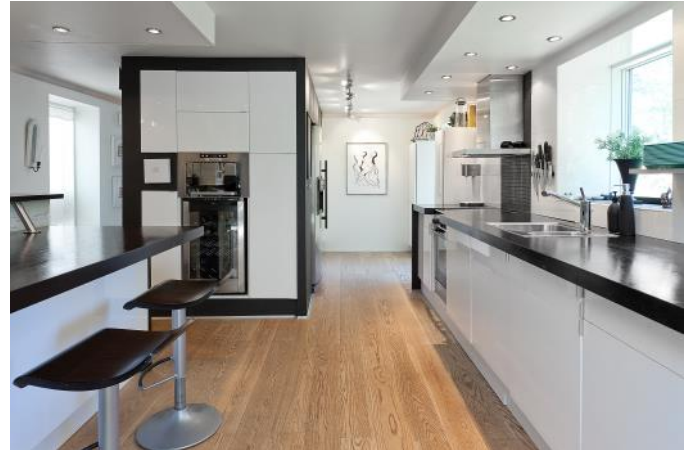
Köket med extremt generösa förvaringsutrymmen