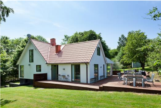
Från Norr (från havsutsikten/Båstad)

Fastigheten säljs i befintligt skick exkl möbler, men kan iordningställas efter Köparens önskemål och behov, varvid ett nytt pris förhandlas. Fastigheten säljs av ägaren direkt, med köpekontrakt och allt "by the book" (advokat som går igenom köpekontrakt).