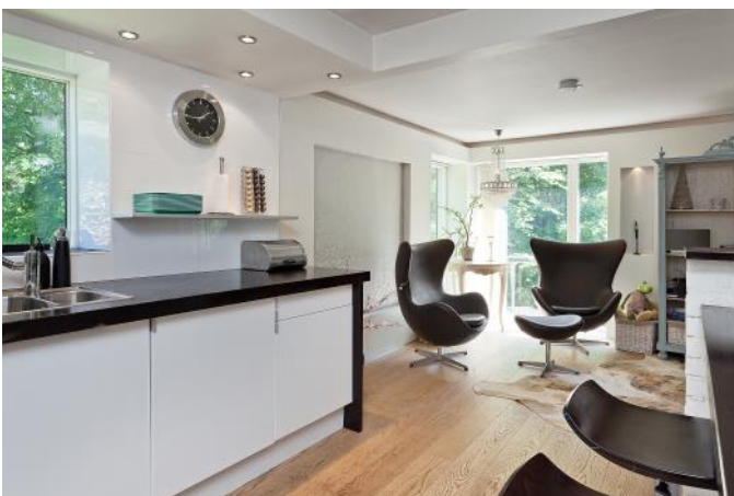
Köket med mycket "sociala ytor"