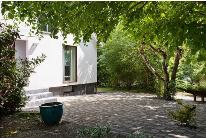
Entrén från Söder