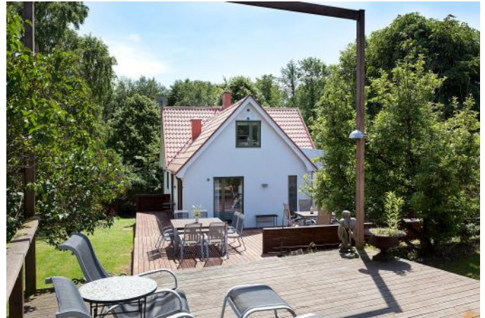
Från Väster (gästhusen)