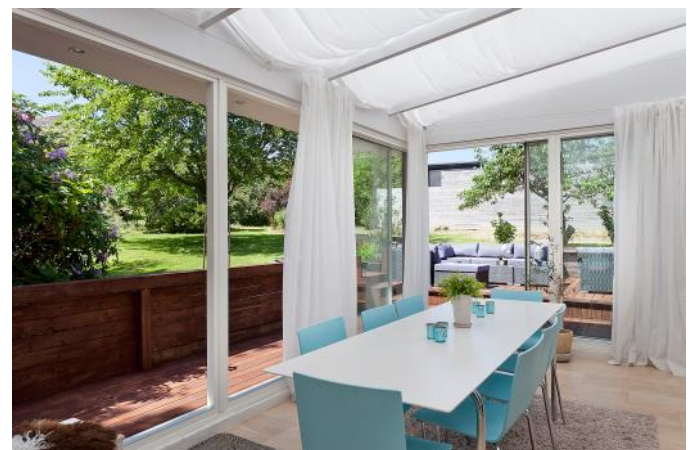
Uterummen med ljus från sidor och ovanifrån