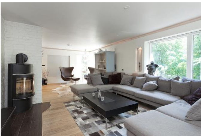
Mycket detaljer med nischer och belysning samt kamin