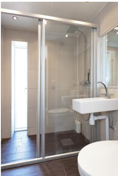
Toalett med dusch