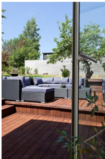
Utgång från uterum till stort trädäck