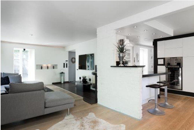
Kök och vardagsrum med öppen planlösning