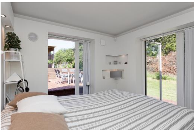
Ett charmigt litet sovrum på bv med tillgång till trädäcken