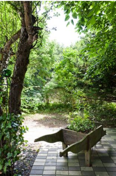
Charmig, lättskött trädgård