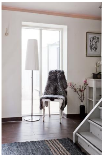
Hall med mycket dagsljus