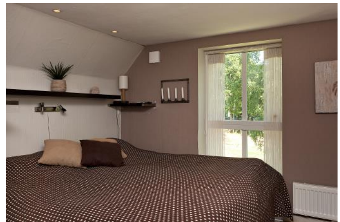
Sovrum (ett av tre) på ovanvåningen