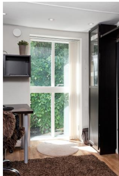
Stora fönster även på ovanvåningen