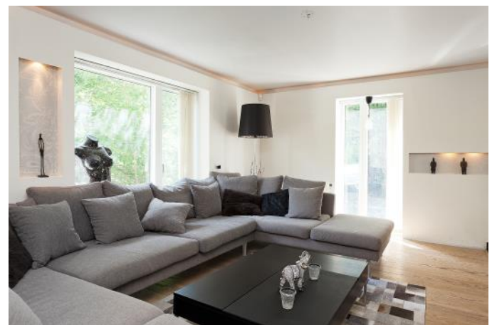
Mycket dagsljus från "de hela" Velfac-fönsterna