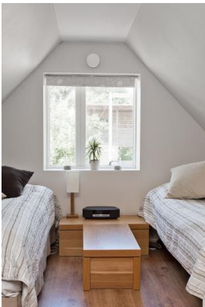
Ett av sovrummen på ovanvåningen